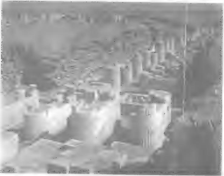
دهليز الأعمدة عام ١٩٢٦ قبل ترميمها على يد مارييت